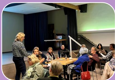
De geheimekracht van vrijwilligers