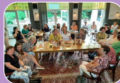
Palliatieve zorg ontmoet Dementie