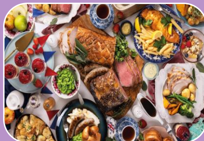
Dood bespreekbaar maken met jongeren