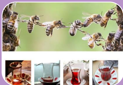
Zingeving van uit cultureel perspectief