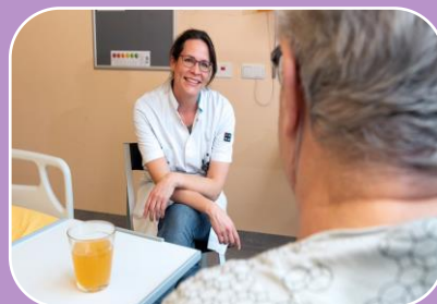
ACP is samen de puzzel compleet maken