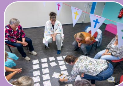
Humor en creativiteit rond het levenseinde

Klik op de afbeeldingen voor het complete verhaal