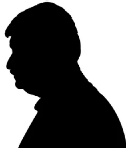
Dhr. K, 60 jaar