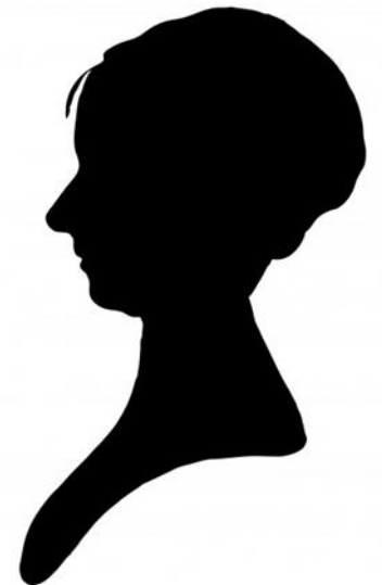
Mw. B., 47 jaar