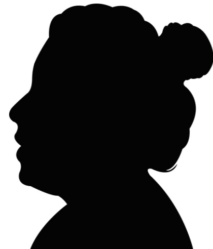
Mw. K, 76 jaar